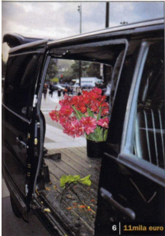
6 11mila euro