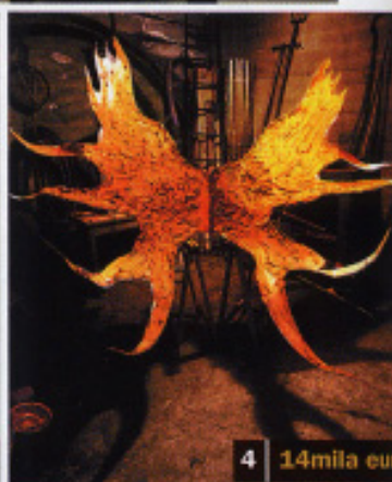
4 14mila euro

1 Roger Ballen, Puppies in fishtanks , 2000, cm 40x40 (Johnen + Schöttle, Colonia e Berlino)