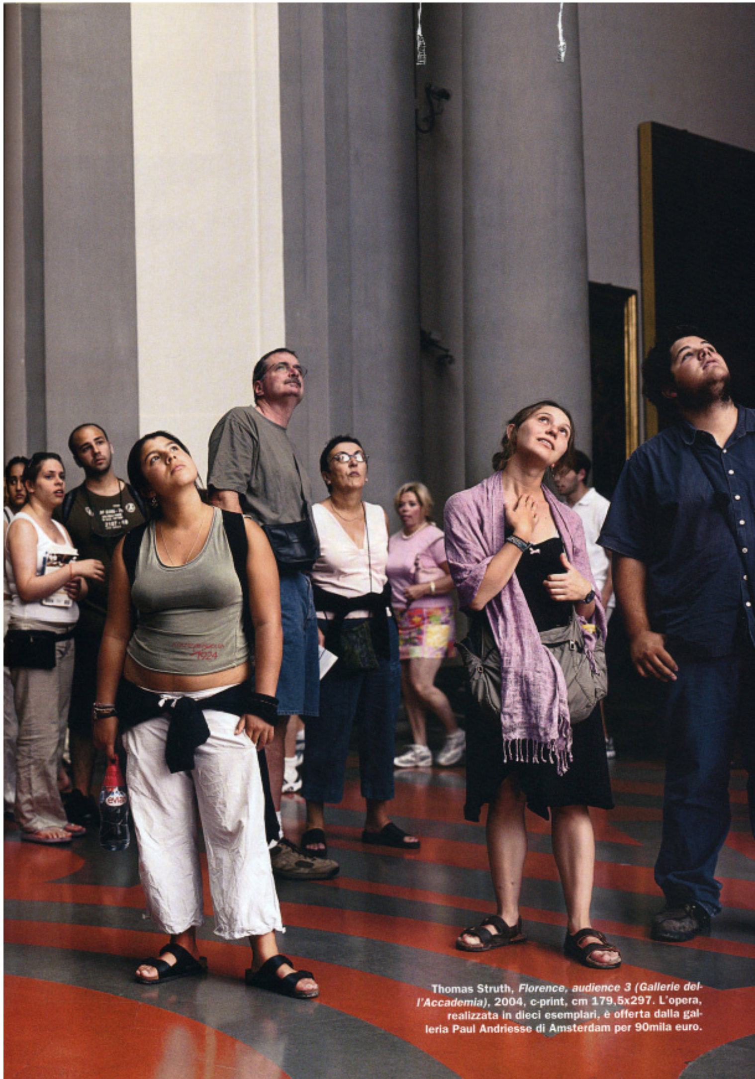
Thomas Struth, Florence, audience 3 (Gallerie dell'Accademia), 2004, c-print, cm 179,5x297. L'opera, realizzata in dieci esemplari, è offerta dalla galleria Paul Andriess di Amsterdam per 90mila euro.