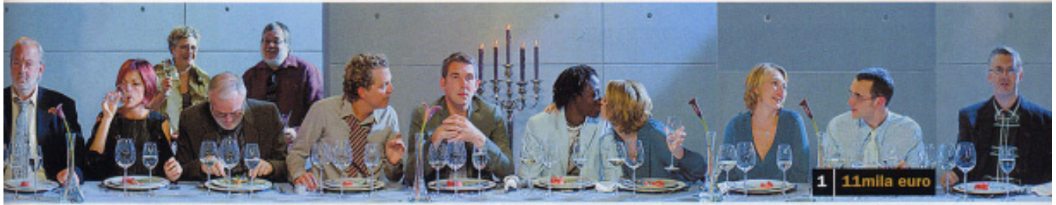
1 11mila euro