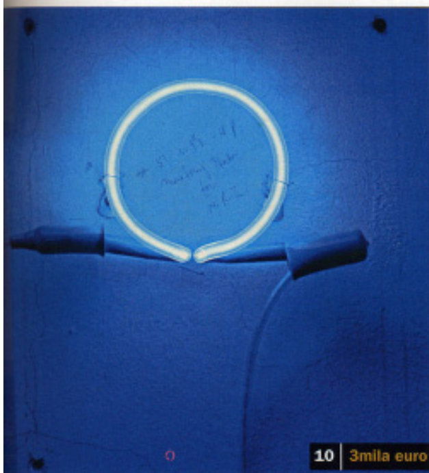
10 | 3mila euro