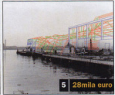
5 28mila euro