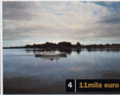
4 11mila euro