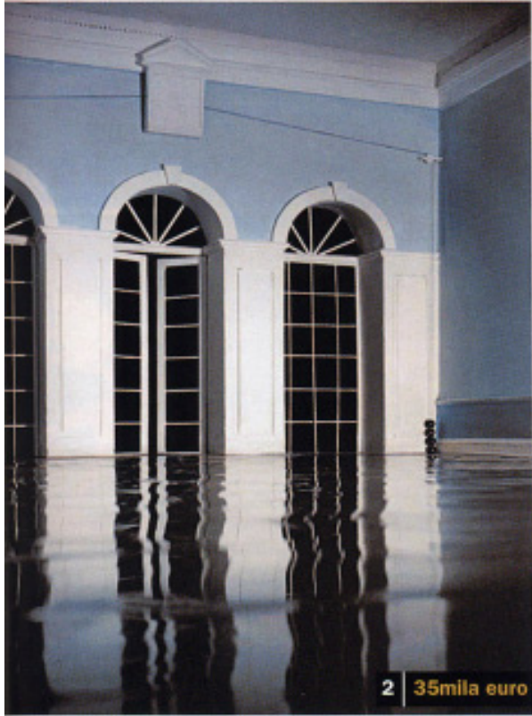
2 35mila euro