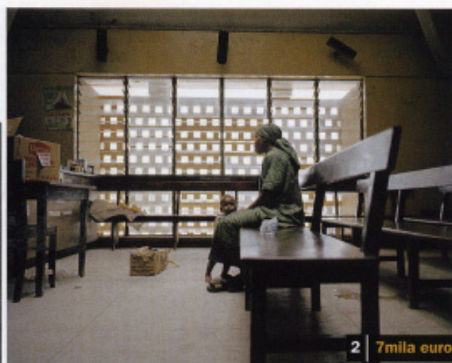
2 7mila euro