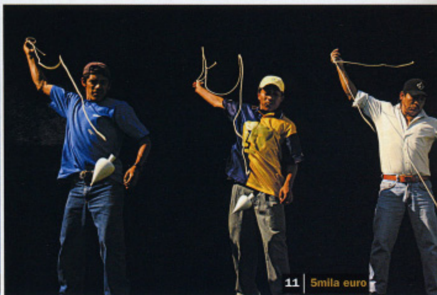
11 | 5mila euro

È tempo di Art Basel , la fiera delle meraviglie che ogni anno anticipa le tendenze del mercato dell'arte moderna e contemporanea. L'anno scorso ha attirato 1.700 rappresentanti dei media e 56mila visitatori. Ancora una volta il fior fiore degli addetti ai lavori e il who's who dei collezionisti di tutto il mondo si ritroverà dunque a Basilea. Il grande spettacolo andrà in scena dal 14 al 18 giugno: confermerà l'euforia che si è respirata nelle sale d'asta negli ultimi dodici mesi?