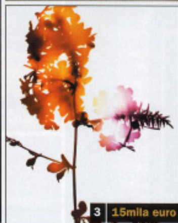
3 15mila euro