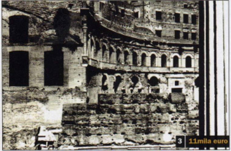
3 11mila euro