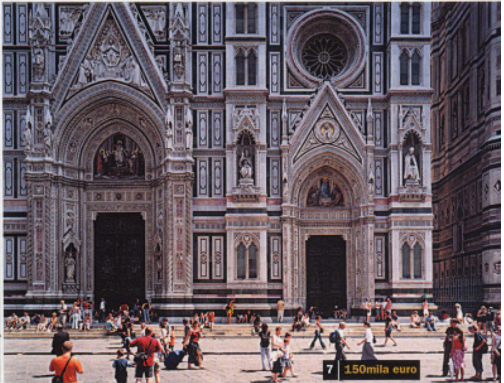
7 150mila euro